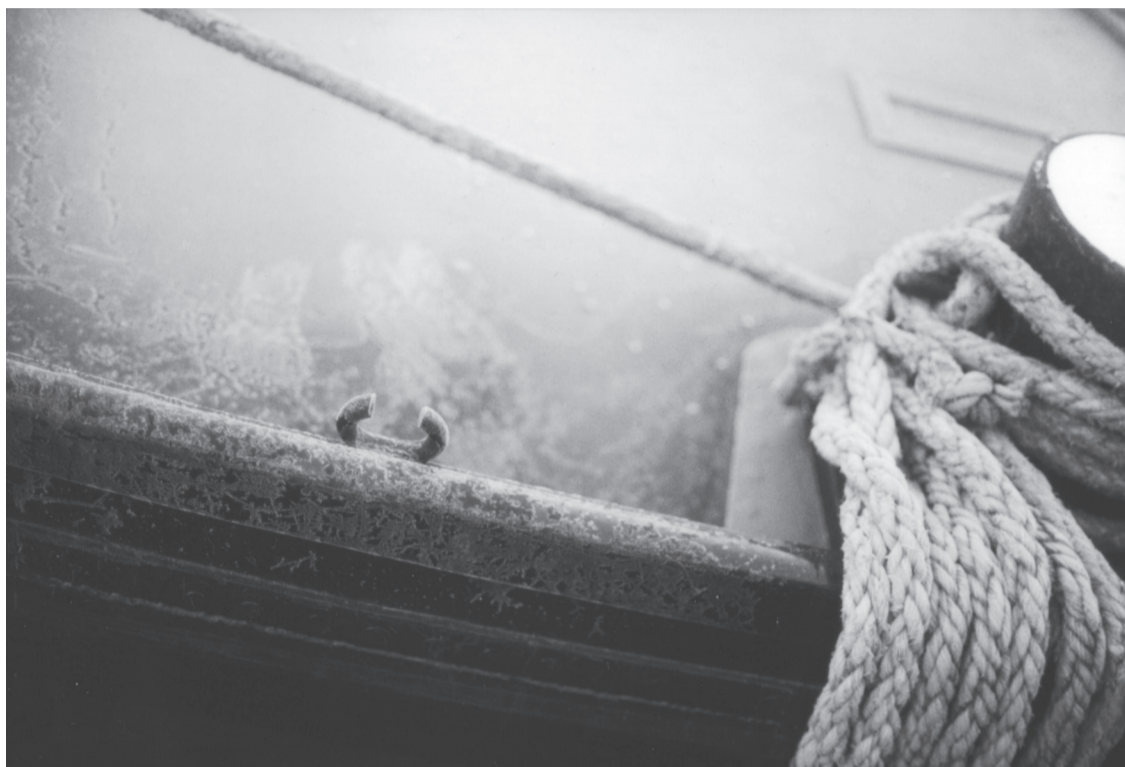
« Ce premier hiver fut un petit cauchemar... »